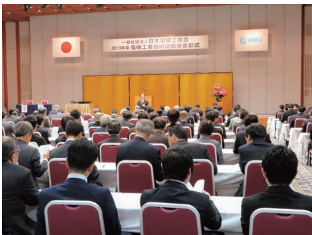
表彰式の会場風景