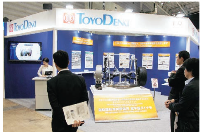
■ 当社出展の様子 「人とくるまのテクノロジー展 2018 横浜」