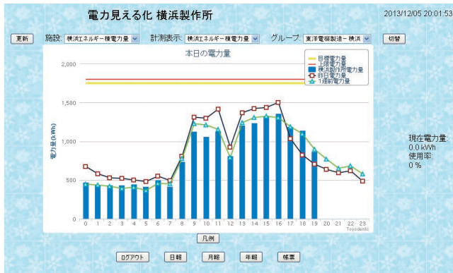
■ 電力使用状況画面

合の施設の電力量がグラフおよび表形式で一括して表示され、省エネルギー計画の立案に役立つ。