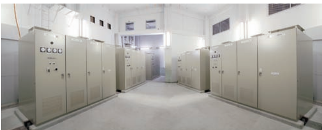
■ 図1 製品外観 Fig.1 Appearance of Product

当社は、株式会社GSユアサ製リチウムイオン電池を蓄電媒体とした、回生電力貯蔵装置のコンバータ部を製作した。