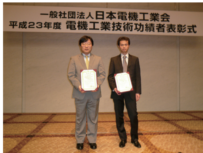
表彰式での記念撮影