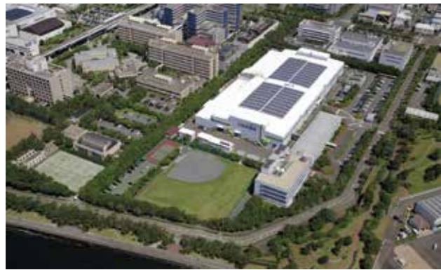
横浜製作所(空撮写真)

今後見込まれる受注拡大に対応するため、交通事業の主力生産拠点である横浜製作所の能力拡大と、産業事業の生産を担う滋賀地区の工場新設・機能集約を行い、売上高500億円体制を構築していきます。