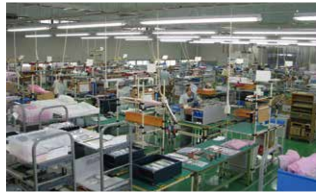
滋賀工場(インバータ製造職場)