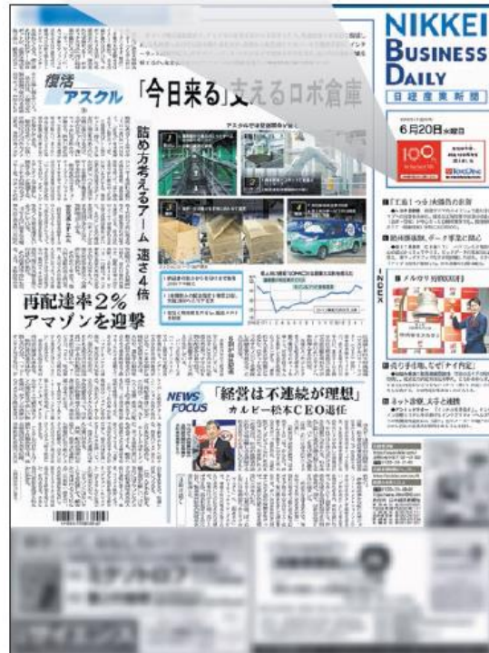
2018年6月20日・日経産業新聞6面全15段